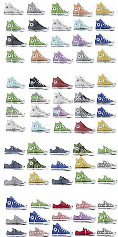
voorbeeld 1 all-star sonnet